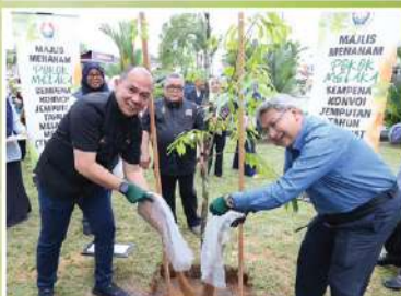
Majlis Perbandaran Alor Setar