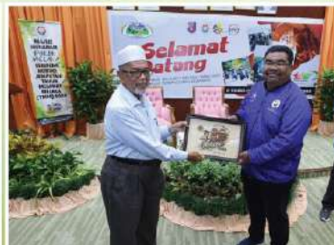
Majlis Perbandaran Kemaman