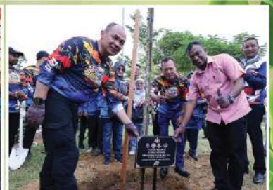
Majlis Perbandaran Port Dickson