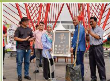
Majlis Perbandaran Kajang