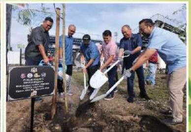
Majlis Perbandaran Manjung