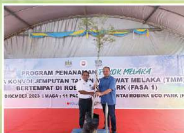
Majlis Bandaraya Seberang Perai