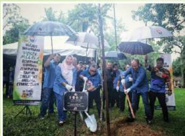
Majlis Perbandaran Kota Bharu