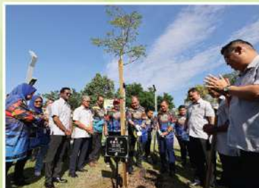
Dewan Bandaraya Kuala Lumpur