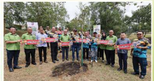
Majlis Bandaraya Johor Bharu