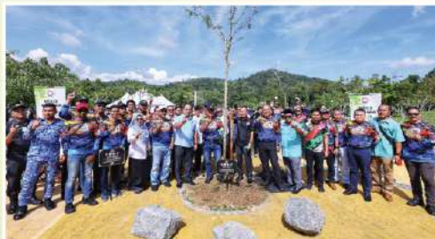
Majlis Perbandaran Bentong