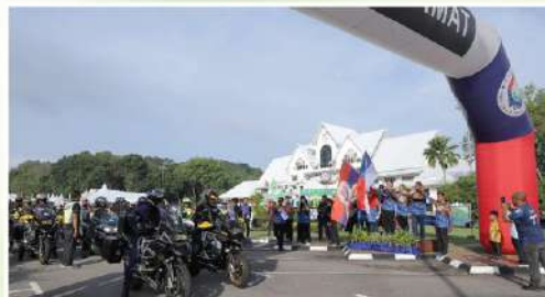
Pelepasan Konvoi TMM 2024

Antaranya Majlis Perbandaran Kota Bharu, Majlis Bandaraya Seberang Perai, Majlis Bandaraya Johor Bharu, Majlis Perbandaran Bentong, Majlis Perbandaran Kajang, Dewan Bandaraya Kuala Lumpur dan Majlis Perbandaran Port Dickson.